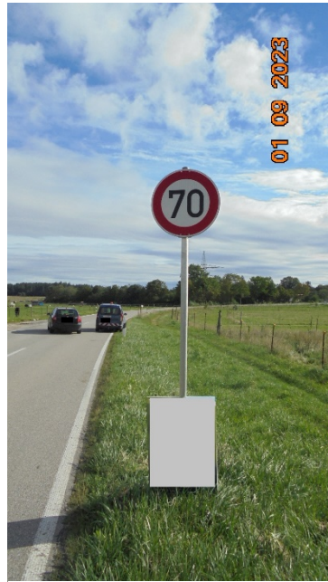
Plakatierung außerorts + Verkehrszeichen