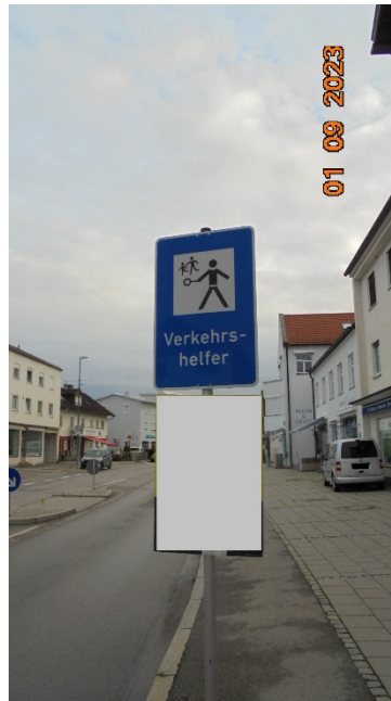
Verkehrszeichen + Sichtbehinderung Fußgängerüberweg