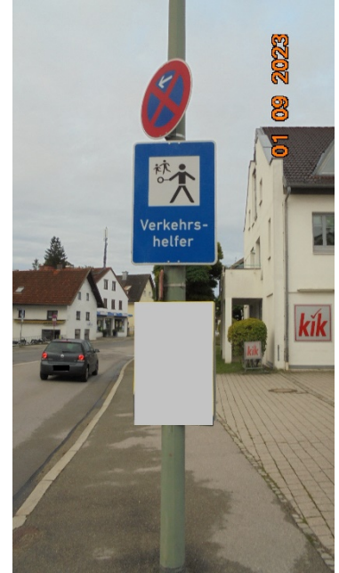
Verkehrszeichen + Sichtbehinderung Fußgängerüberweg