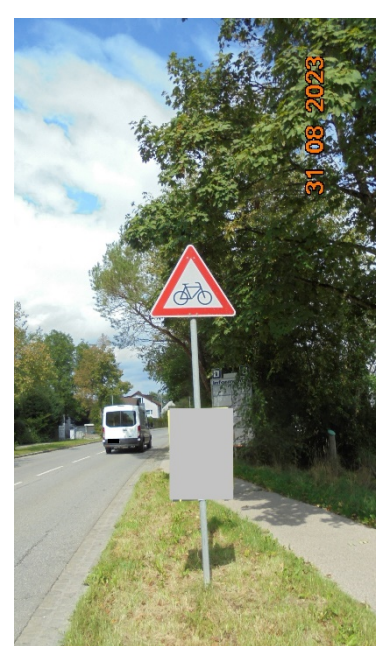
Verkehrszeichen + Sichtbehinderung Radweg-Ende