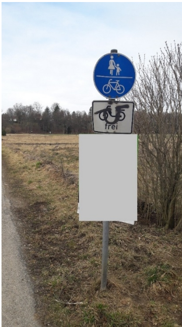
Landschaftsschutzgebiet + Verkehrszeichen