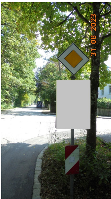
Verkehrszeichen + Sichtbehinderung Kreuzung